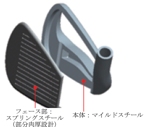
図1：高反発L字カップフェース

この結果、飛距離アップを実現するとともに、高いボールを打ち出すことが出来るようになり、またスピン量も増え、止めたい位置にボールをコントロールしやすくなりました（下図2）