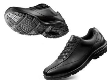
ウォーキングシューズ「LD40 IV」 ¥16,000+税（税込価格：¥17,280）

8種類のカラーバリエーション（男性用5カラー、女性用3カラー）をラインナップし、日常の外出シーンや長距離ウォーキング、旅行など幅広いシーンで使用することができます。