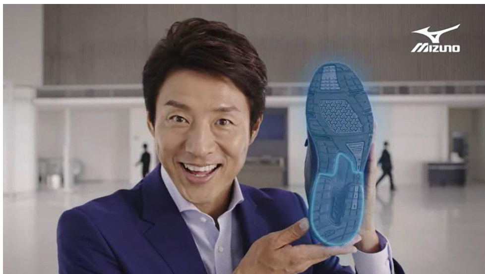
《ウォーキングシューズ LD40 IV プロモーションビデオ画面》