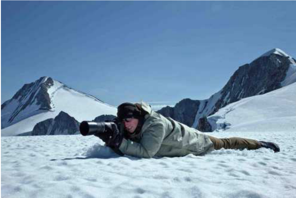
ポール・ニックレン氏