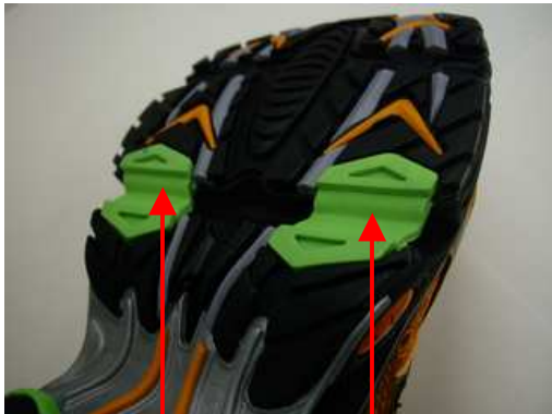
過剰な屈曲を抑えたパーツ

これまでランニングシューズにおいて、屈曲性が優れたものが良いと言われてきましたが、ミズノでは走行時の着地から蹴り出しまでのエネルギーロスに着目し、より少ないエネルギーで蹴り出せる屈曲の度合いを導き出しました。蹴り出しの際の過剰な屈曲を抑えたパーツをソールの屈曲位置に採用し、より少ないエネルギーで走ることを追求しています。またかかとのプレートの端をたわみやすい形にすることで、着地の際に地面からの突き上げを抑え、スムーズな体重移動を追求しています。