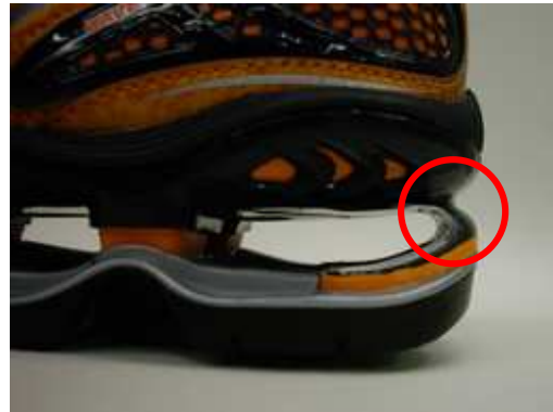
突き上げを抑える、たわみやすい形状