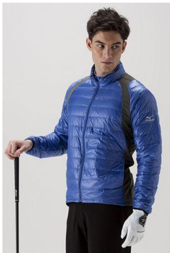
ブレスサーモダウンジャケット「ムーブダウン」

この「ムーブダウン」は、ゴルフ時に着用してもプレーしやすく暖かいダウンジャケットとして昨年発売し、その動きやすさからも大好評で、今年はさらにメンズの新色を3色追加して発売します。また、ミズノ独自の吸湿発熱素材『ミズノ ブレスサーモ』を使用しており、非常に軽く暖かな着心地です。