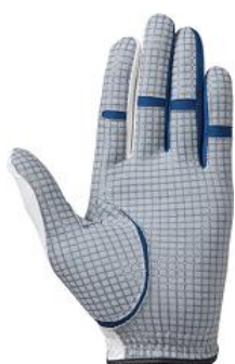
※1『シリコンプリント加工』（手袋外側の手の平側の写真）

通常的人工皮革に比べ、ゴムラバーに対する摩擦抵抗値が、ドライな状態で約2倍、ウエットな状態で約1.7倍と大幅にアップし（ミズノ調べ）、雨や汗で濡れても高いグリップ力を保ちます。