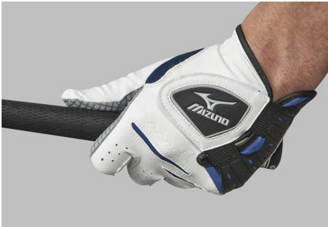
ゴルフ手袋「バイオロックプラス/ダブルグリップ」

これは従来の手袋内側の特殊加工『ダブルインナーグリップ加工』 ※2 に加えて、手袋外側に汗や雨による滑りを抑える『シリコンプリント加工』 ※1 を施すことで、従来の加工が無い手袋と比べて、摩擦抵抗値が約2倍にアップ、グリップ力も約10%向上しました。これにより、より高い密着度でフィット感を得られ、スイング時のきり返しやインパクト時の瞬間的なズレを抑える効果を発揮します。また、本年度より新しくなったゴルフルールにも適合しています。