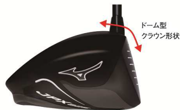
図4：ドーム型クラウン形状

またクラウンの形状をドーム型にすることで(下図4)、フェース上部でボールを打った場合でもエネルギーロスを抑え、安定した飛距離性能を発揮します。