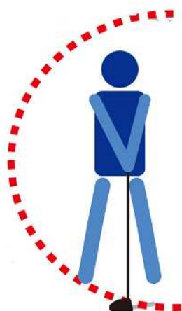
図1：「スイング半径」の小さいゴルファー

ゴルファーのスイングを調べた結果、「スイング半径」の小さいゴルファーは、ダウンスイング時のゴルフクラブの軌道が体に近いためスイングのばらつきが少なく、ミート率が高めであることがわかりました（下図1）。反対に「スイング半径」の大きいゴルファーは、ゴルフクラブの軌道が体から遠いため、スイングのばらつきが多く、ミート率が低めであることがわかりました（下図2）。