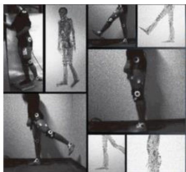
【図1：筋骨格シミュレーションの検証実験】

※ 1 コンピューター内で身体動作のデータと身体に加わる外的な力のデータを基に、運動時にどの筋肉がどれくらい働いているかを検証する動作解析方法