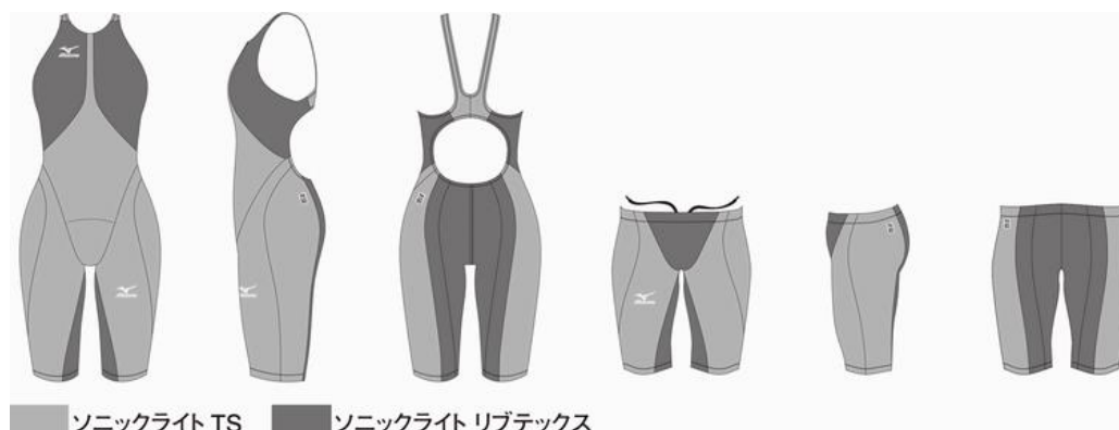
【図4：生地サポート部分】

薄くて軽い素材『SONIC LIGHT TS(ソニック ライト ティーエス)』を使用しています。この布帛素材（織物）を使用することで、泳ぐ際に腕や脚が動かしやすくなるとともに着脱しやすくなっています。（図4参照）