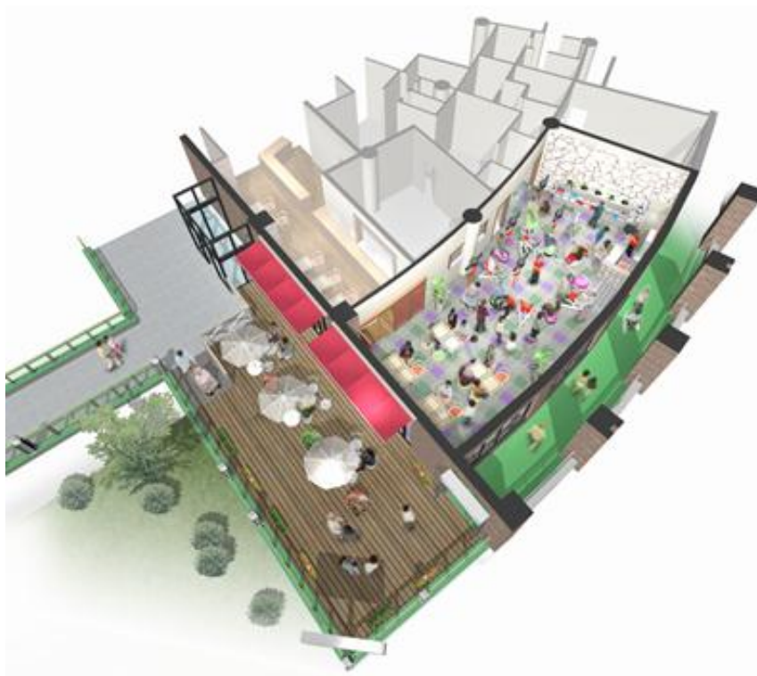
「LIC ウェルネスゾーン」完成予想風景

ミズノでは、「LIC ウェルネスゾーン」を「場（内装工事、スポーツ施設の設計・施工）」、「モノ（トレーニング機器他）」、「サービス（運営・プログラム展開）」が一体化した新たな施設運営サービス事業と位置づけており、同様の施設を今後積極的に展開していきます。