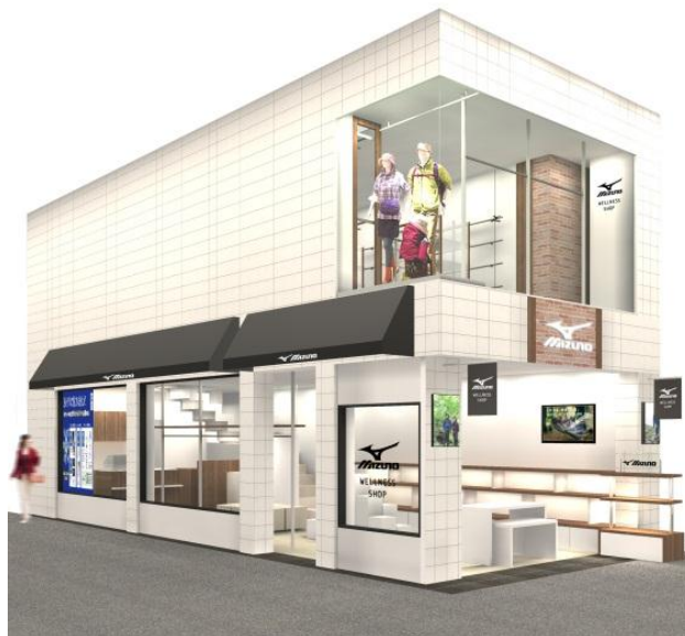
「ミズノウエルネスショップ 京都新京極」※画像はイメージです。

http://www2.city.kyoto.lg.jp/sogo/toukei/Population/index.html