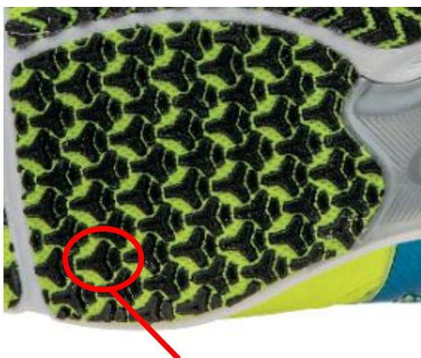
左：三方向に向いた突起 右：高さの低い突起

強い蹴り出しを生むために重要となる部位で、前方だけでなく左右方向にも力がかかるため、樹脂製の突起の形状を三方向に向かせることで複数方向へのグリップ性を持たせています。また、突起は2段階に高さを分けて配置しているため、激しいランニングにより高い方の突起が磨耗しても、低い方の突起がグリップ性能を発揮します。