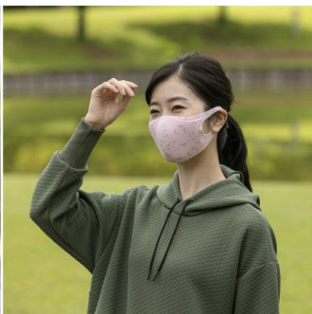
ニュアンスピンク