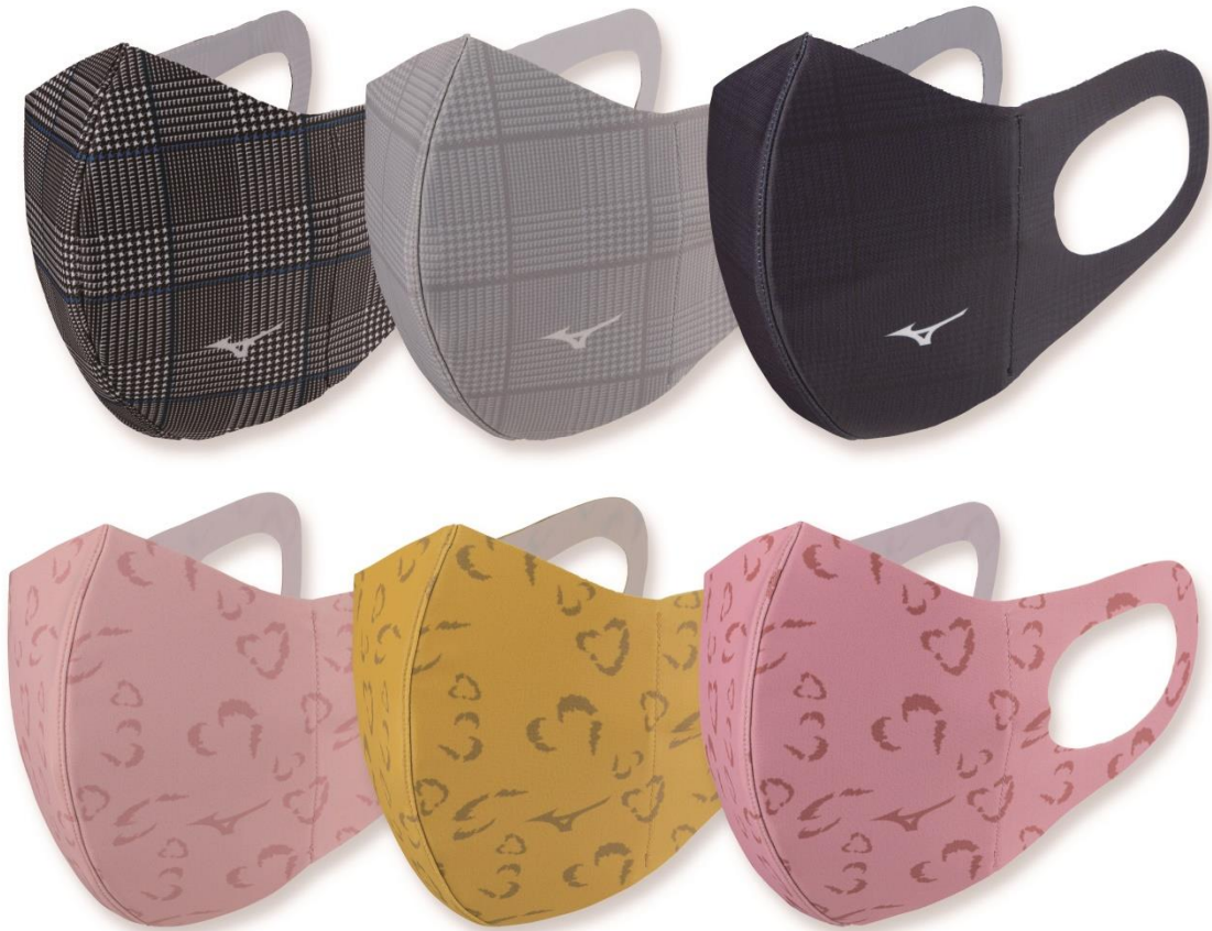
「ミズノマウスカバー」上：グレンチェック柄 下：ハート柄

ミズノは、グレンチェック柄とハート柄をプリントした「ミズノマウスカバー」を、ミズノ公式オンライン・マウスカバー専用サイトと一部のミズノ直営店で10月11日に発売します。